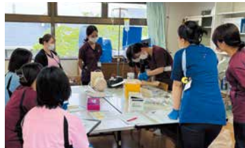
2024年度 看護部新人職員研修一覧